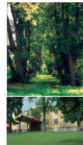
Majątek Wajsznory w oczekiwaniu na gości