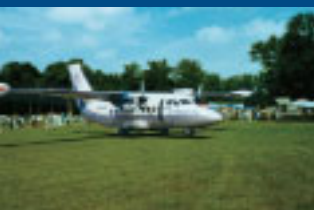
„Turbolet 410” z wizytą w Wilamowie