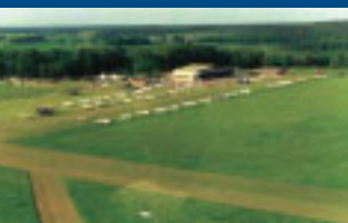
Spojrzenie na lotnisko z samolotu