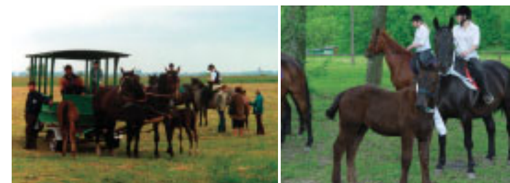
Na chętnych czekają... wozy, bryczki... i konie