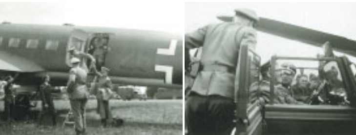
1942 r. – przylot Hitlera... i odjazd do Wilczego Szańca